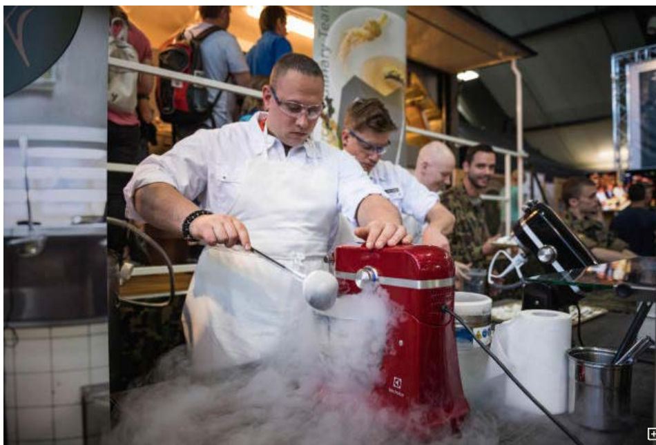
Ein WK-Soldat bereitet mit flüssigem Stickstoff ein Dessert vor.

ALLMEND · Die Zentralschweizer Frühlingsmesse fand in den letzten zehn Tagen bei bestem Wetter statt. Das wirkte sich vor allem auf den Glacestand der Armee aus – die Besucherzahl bewegte sich hingegen auf Vorjahresniveau.